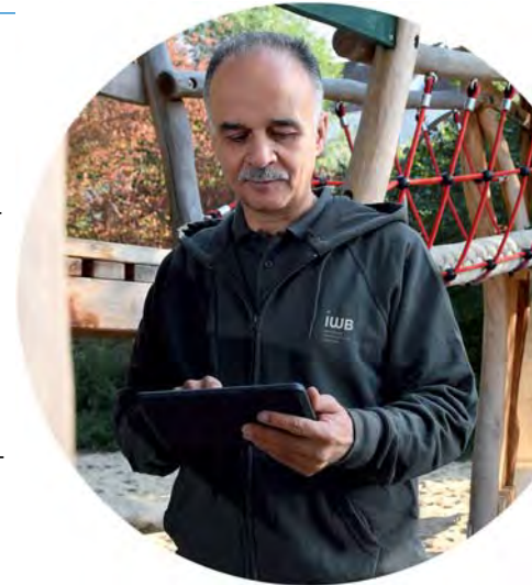
Abb. 1: Spielplatzkontrollen durch iwb-Experten

Unser bewährter Standardkatalog, nach dem wir Bestände erfassen, enthält insgesamt 216 Inventarpositionen. Dieser Katalog kann selbstverständlich an Ihre individuellen Anforderungen angepasst werden. Das ist ganz davon abhängig, wie „genau“ Sie es gerne hätten. Unser Erfasserteam besteht aus erfahrenen Ingenieuren und Bau-technikern, deren geschultes Auge genau weiß, wohin es blicken muss. Durch unsere bewährten Prozesse erfassen sie ganze Gebäudekomplexe genauso detailliert wie einzelne Wohnungen zu kalkulierbaren Zeit- und Kostenumfängen.