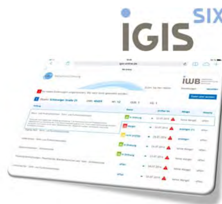
Abb. 3: Mobile Verkehrssicherungsprüfung

Mit IGIS online lassen sich Verkehrssicherungskontrollen komfortabel und rechtssicher vor Ort dokumentieren.